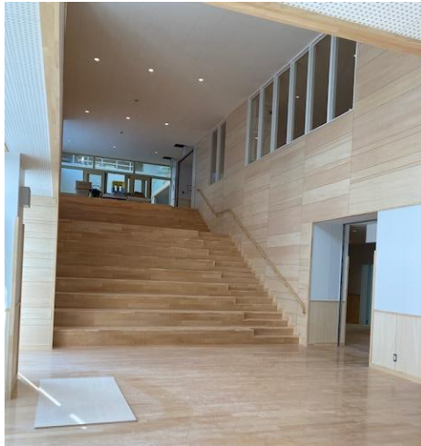
← ↓ < イベントスペース・玄関 >

さくねんど 昨年度から、 しんこうしゃけんせつ 新校舎建設の様子を少しずつお伝えしてきましたが、 がつまつ いよいよ1月末で校舎本体の工事が終わります。 こんかい 今回は、 ないぶ 内部の様子を しゃしん 写真を掲載します。